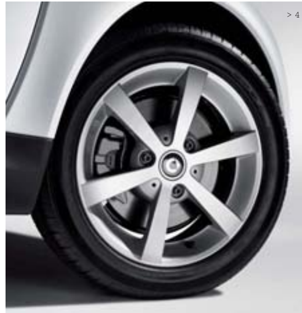
> 4 6-Speichen-Leichtmetallräder (15", Design 3): Für Bereifung 175/55 R15 vorn und 195/50 R15 hinten.