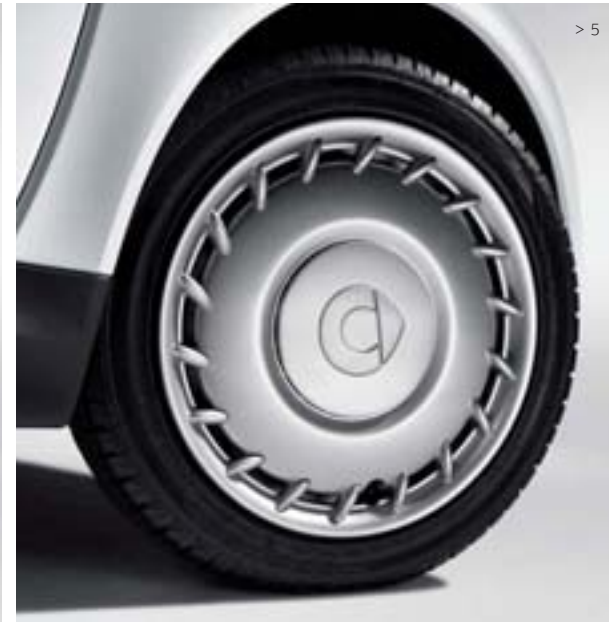
> 5 Radzierblenden: Verschönern die serienmäßigen Stahlfelgen und schützen die Radbefestigungsschrauben vor Witterungseinflüssen. Nicht nur für Winterräder ideal.