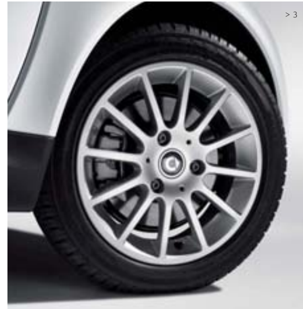
> 3 12-Speichen-Leichtmetallräder (15", Design 1): Für Bereifung 155/60 R15 vorn und 175/55 R15 hinten.